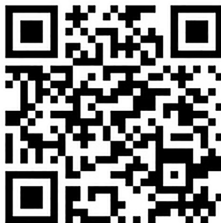
Sortie du mercredi