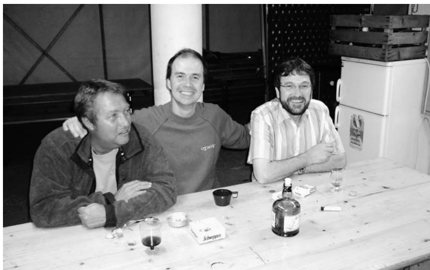
En toute fin de soirée