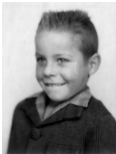
Voyez la coupe en brosse !

Puis, je suis parti faire mon « Tour de France » 2 : Nancy, Verdun, Nîmes..., et enfin Toulon.