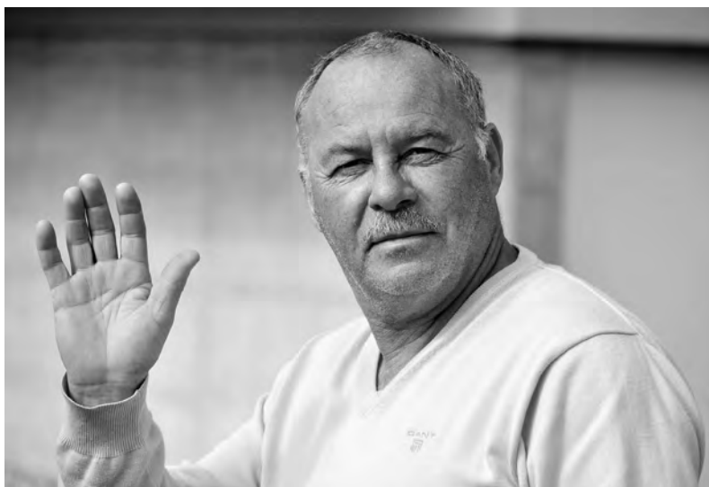
En vacances (!) au Club house