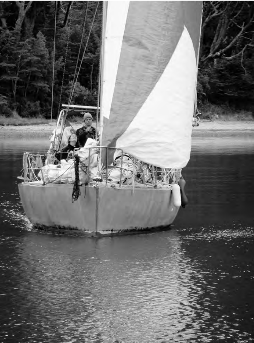
Arrivée au mouillage de Caleta Olla dans la pétrole