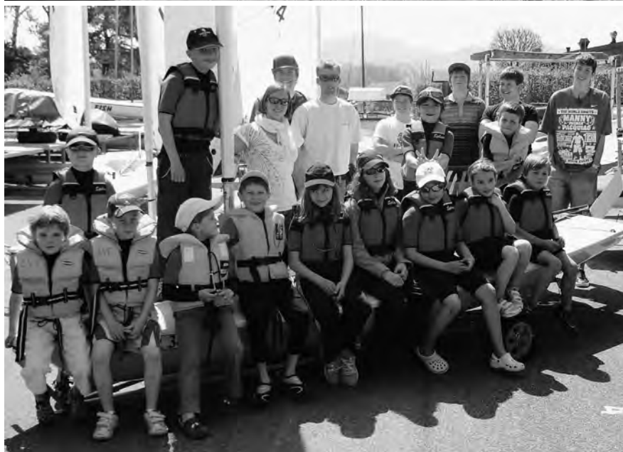
En haut : le matin, après la voile