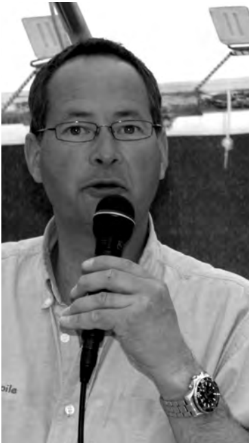
Notre coordinateur des 100 Milles

Les 100 Milles de Pentecôte ne seraient pas ce qu'ils sont sans la participation des passionnés de croisière. En effet, depuis sa création il y a plus de 30 ans, cette régata au long cours