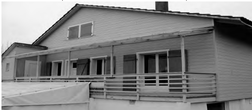
Façade refaite sur une isolation périphérique

Pendant les travaux, la météo pluvieuse et venteuse nous a permis de constater en direct que de l'eau continuait de s'infiltrer par le sol du balcon. Nous avons donc profité de la présence du menuisier pour améliorer ce sol et surtout son étanchéité. Désormais, cet endroit a une légère pente qui permettra à l'eau de s'évacuer vers l'extérieur du chalet. Ces quantités d'eau infiltrées pendant des années ont provoqué une détérioration rapide des installations de la cuisine et du plafond du réfectoire.