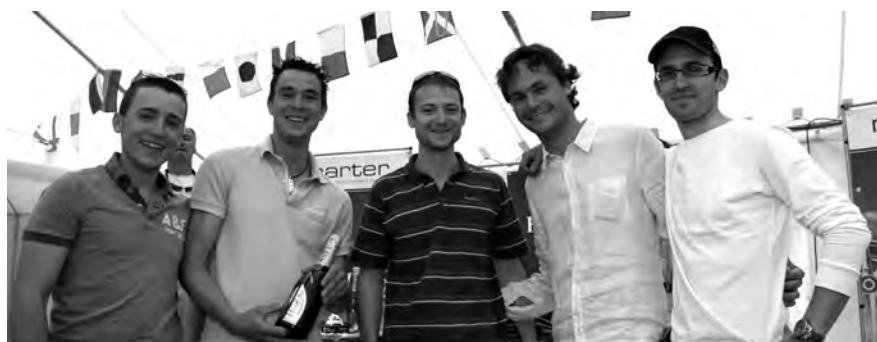
Alarrache gagne le petit parcours