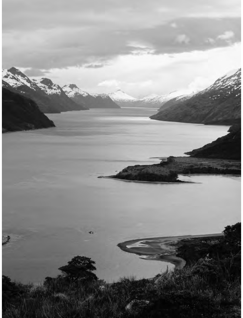
Vue sur Caleta Olla et le canal Beagle depuis les hauteurs

Passée la ville de Punta Arenas, nous continuons vers le Sud, plongeant d'un coup dans les Andes qui, elles, plongent dans l'océan. Beau plongeon, du genre presque trop beau pour être imaginable. Le canal de Magdalena sera emprunté et avalé en une journée. Nous goûterons - un instant - à l'eau du Pacifique avant de repartir à l'Est,