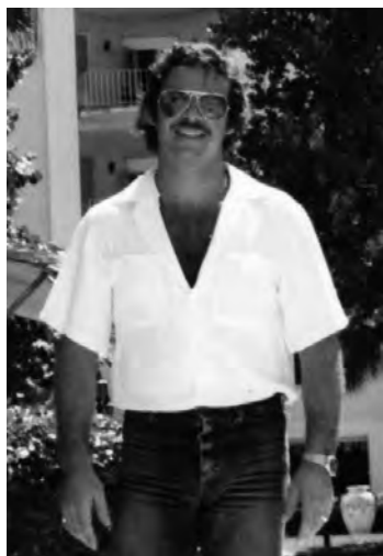
En vacances à Miami !

À 22 ans, je me suis embarqué sur des câbliers 3 comme cambusier 4 .