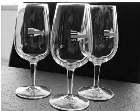
Verres à vin CVE, au prix de 25 fr. le carton de 6

D'autres articles comme les « Pavillons CVE » et « Autocollants CVE » sont également en vente.