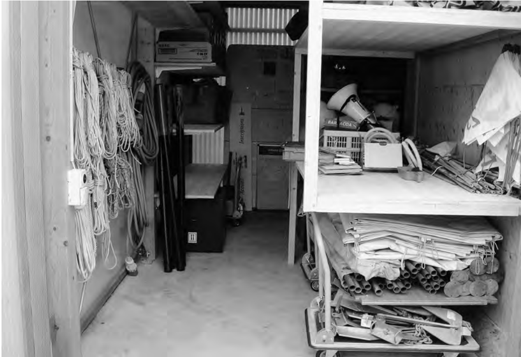
Le module 1