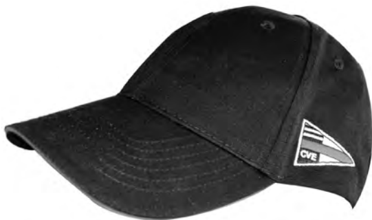
Casquettes CVE, au prix de 15 fr. la pièce

*au secrétariat, rue du Camus 3 le soir de 16 h à 18 h ou sur rendez-vous