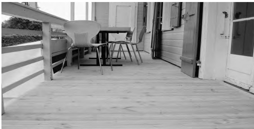
Face Sud avec le nouveau sol du balcon

Comme vous l'avez certainement remarqué, notre chalet du CVE a fait peau neuve sur les faces Sud, Est et Ouest.