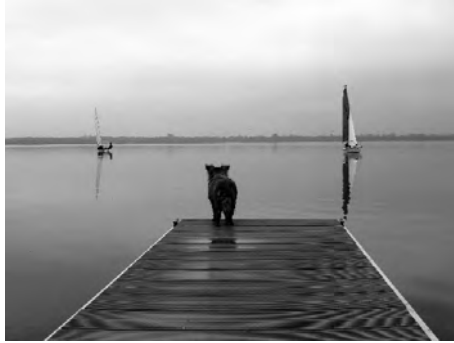
(Le chien aussi cherche le vent)

Manche annulée ! Enfin un tour de terminé ! Encore une manche ! Voilà le résumé des régates de cette saison... À croire que nos efforts pour organiser ces manifestations ont été vains. Mais il n'en est rien. La collaboration de nos membres est remarquable. Je suis très surpris de constater le nombre de bénévoles qui participent à l'organisation de nos régates, que ce soit la préparation, durant la manifestation ou pour le rangement. Cela me réjouit. Un chaleureux merci à toutes ces personnes qui ont contribué au bon déroulement de nos activités, même si le suspense n'était pas au rendez-vous en raison de la météo.